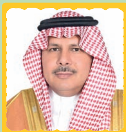
SEM Abdullah Bin Hamad ALSOBAIEE, Ambassadeur de l'Arabie Saoudite en Côte d'Ivoire