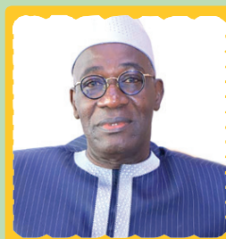
M. Farikou SOUMAHORO, Président de la Fédération Nationale des Acteurs du Commerce de Côte d'Ivoire (FENACCI)