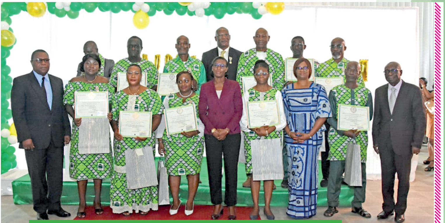
Remise de médailles d'honneur du travail à 43 agents de l'UNACOOPEC-CI. Meilleure microfinance sur trois années consécutives 2020, 2021 et 2022.

L'UNACOOPEC-CI réitère ses remerciements à l'ensemble de ses partenaires, notamment aux Autorités ivoiriennes, à leur tête le Président de la République, SEM Alassane OUATTARA, son Epouse Madame Dominique OUATTARA, Première Dame de Côte d'Ivoire et le Gouvernement pour la marque de confiance qu'ils continuent de placer en elle, pour une amélioration constante des conditions de vie de la population ivoirienne. Elle invite les bénéficiaires à opérer un remboursement optimal des prêts contractés pour la réalisation de projets encore plus nombreux. Parce que chacun a droit au bonheur !