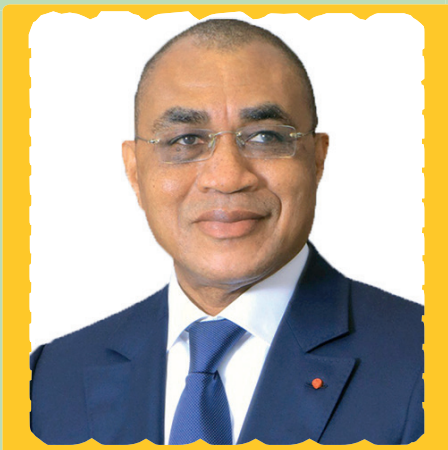
M. Adama COULIBALY, Ministre de l'Economie et des Finances